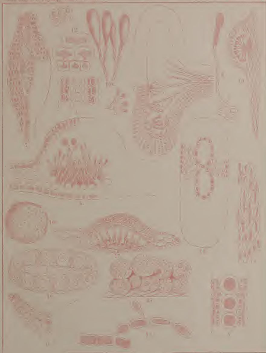
Fig. 1-3 Nitophyllum proflerum . Fig. 4-6 Rhodessa tenuis Harn. Fig. 7-8 Rhodessa carolinensis Harn. Fig. 9-10 Platycina Onizien? Fig. 11 Platycina stipitata Harn. Fig. 12-14 Herpessiphora saxatilis . Fig. 15-18 Bulbocorps proflera