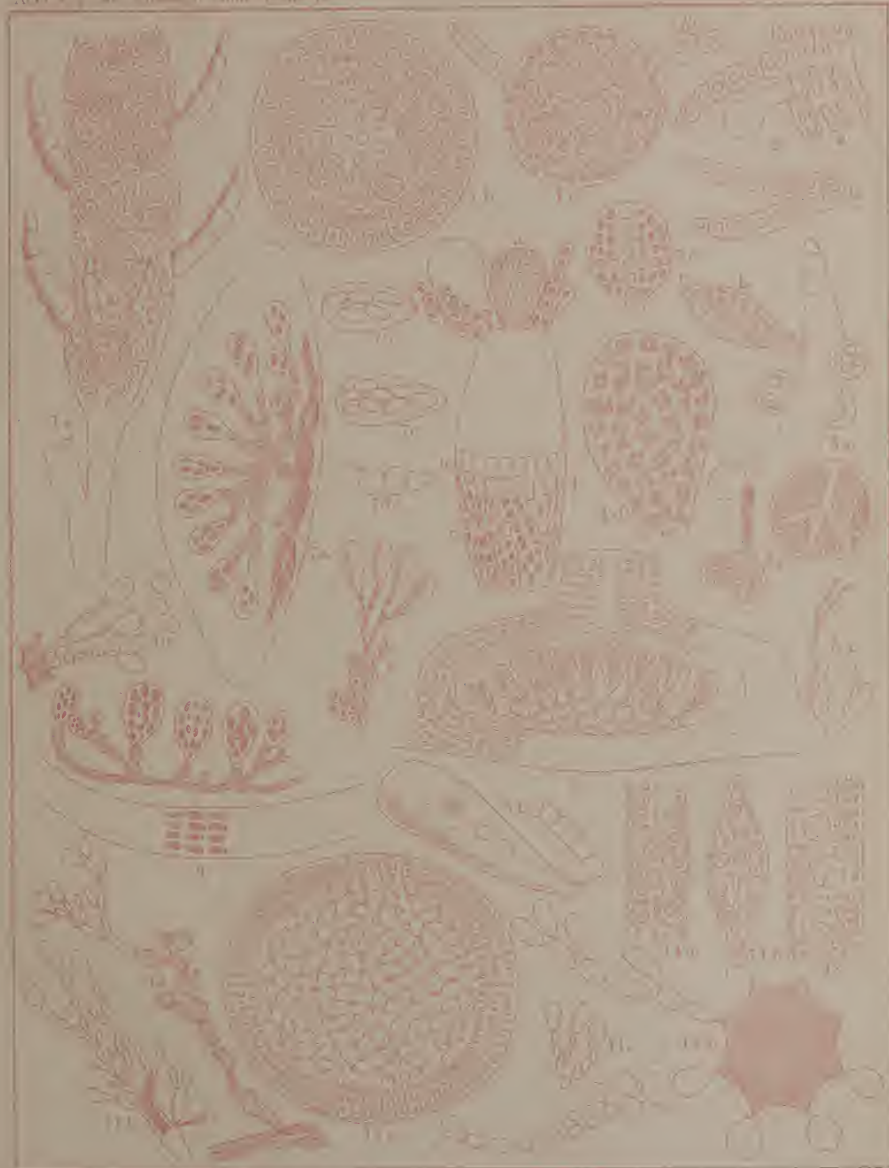
Fig. 1-6 Trigona umbellata . Fig. 7. (a-d) Neomelipotum Endermanni . Fig. 8 Neuroglossum f. scutellum . Fig. 9 Schizocampa dichroma . Fig. 10 Rhynchosia fasciata . Fig. 11 (a-b) Delocera curvata . Fig. 12 Pteridium reticulatum . Fig. 13 Haliplus similis . Fig. 14 Pteridium pleuroperum .