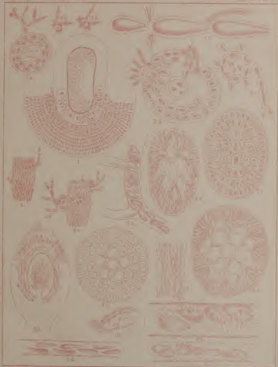
Fig. 1 Gloiohymentia orillata . Fig. 2 (a-f) Halicantha incrustans . Fig. 3 (a-c) Eudorez nutans . Fig. 4, 4a, 4b, Micropeuce strobilifera . Fig. 5 (a-d) Pyropia saliformis . Fig. 6 (a-d) Englemia poliformis .